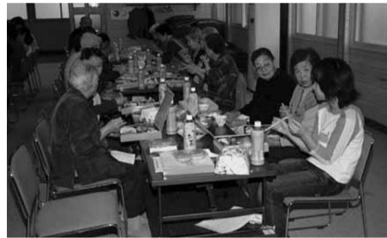
【指定町内会】大黒2町内会・大黒3町内会・こまどり町内会・日吉町内会・ひかり町内会・今恵町内会・豊浜町内会・潮見第2町内会・恵比須町内会・下勇知町内会

今年度は、下記の市内10町内会を指定させていただき、現在各町内会役員、福祉委員、民生児童委員、育成部などの協力をいただいて準備を進めております。